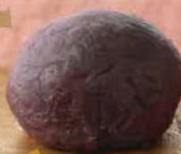
こしあん (大葉入り)